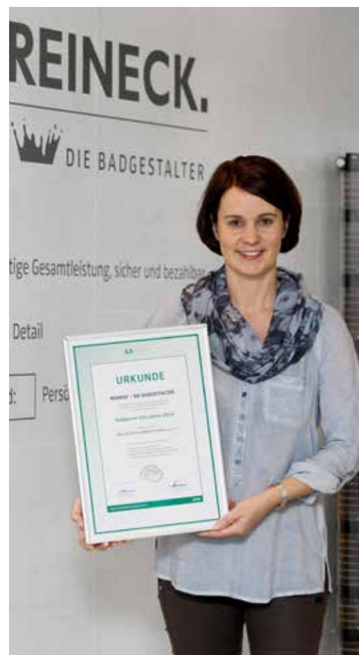
„Wir bieten spezielle Lösungen“ – mit Erfolg. Die Firma Reineck wurde als „Badplaner des Jahres 2014“ ausgezeichnet.

Zudem hatte sie durchaus Gefallen an der Rolle als Unternehmerin gefunden. Man merkt, wenn sie erzählt, wie viel Spaß es ihr macht, etwas zu bewegen und das Geschäft mit eigenen Ideen voranzubringen. Dabei hat sich auch ihr Aufgabenfeld mit dem Wachstum des Unternehmens erweitert. Mit inzwischen